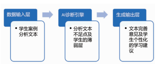
图2 AI生成个性化学习建议过程