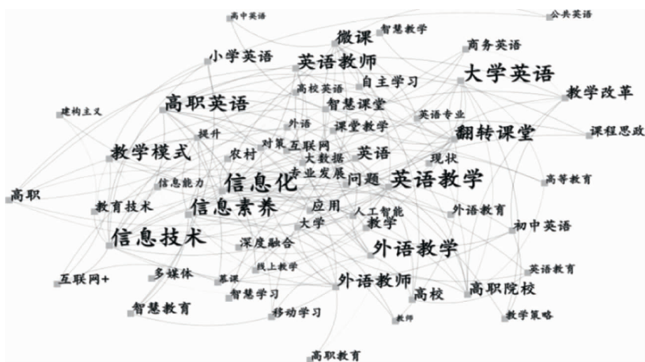
图2 我国外语教育信息化关键词共现图谱

第四,提高外语教师信息素养是研究的热点之一。这从析出的高频词“信息素养”(频度 42)、“英语教师”(频度 35)、“外语教师”(频度 17)、“教学改革”(频度 21)、“专业发展”(频度 15)等可以看出。提高外语教师信息化水平需要从三方面展开:一是培养教师信息化教学意识;二是提升教师运用信息技术的有效程度;三是创新性设计信息技术与教学内容整合 [9] 。另外,教师信息素养提升最终要以提升教学效果为导向,“实践是检验真理的唯一标准”,在持续的信息化教学实践中不断收获反馈是提升外语教师信息化素养的最终途径。