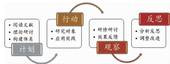
图 1 行动研究流程

塔格特 (McTaggart) 提出的研究思路四步骤——计划、行动、观察和反思,结合自身实际情况,将本研究分为四个阶段:指标体系初步制定阶段(计划)、应用实践阶段(行动)、效果反馈阶段(观察)、改进反思阶段(反思)。本研究所收集的资料主要来自调查问卷、参与者访谈以及参与者为期三周的讨论与反思记录。四个阶段具体流程如图 1 所示。