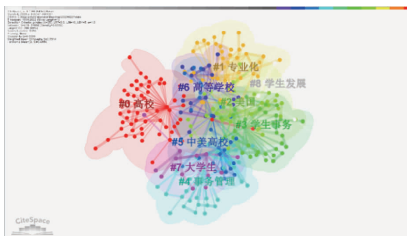
图3 我国高校学生事务管理研究关键词聚类图谱

(1)高校学生事务管理专业化。所谓“专业化”,是指某项工作由经过专门培训的专业人员专门从事并且不断提高的一个过程 [9] 。高校学生事务管理专业化通常包括系统的理论基础、明确的专业标准、丰富的专业内容、科学的专业训练、职业化的工作队伍五大要素 [10] 。高校学生事务管理专业化是提高学生工作质量的关键,也是高等教育改革不断深化发展的内在要求,该领域的研究一直是我国学者关注的重点。自十一届三中全会以来,我国高等教育得到恢复和发展,国家日益关注高校学生事务管理专业化的问题,陆续颁布《关于教育体制改革的决定》《教育部关于进一步深化本科教学改革全面提高教学质量的若干意见》等文件,为高校学生管理工作专业化提供政策上的支持和引导,促进了该领域专业化的发展。自改革开放以来,我国高校学生管理工作专业化进程历经萌芽、起步、稳定、全面发展四个阶段,专业化程度不断提高 [11] ,形成了理论研究团队与高层实务人员并存的研究群体、专业组织与学术会议构成的研究平台以及由实践引介转向理论创生的研究范畴 [12] 。我国高等教育建设起步晚,尽管高校学生事务管理的专业化水平不断提升,但和西方发达国家相比仍存在较大差距。为弥补此种差距,促进我国高等教育发展,大量研究从我国教育实际出发,关注如何加快专业化进程和构建专业化的工作体系。我国高校从事职业化学生事务管理的队伍主要是辅导员队伍。辅导员受过一定的专业训练,在高校学生事务管理中发挥着不可或缺的重要作用,是学生发展的引路人,对学生的成长至关重要。辅导员队伍的专业化发展水平和我国高校学生事务管理的专业水平息息