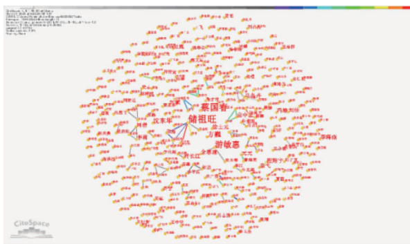
图2 我国高校学生事务管理研究作者合作网络图谱

洛特卡定律表明,在一个成熟的研究领域,写一篇论文的作者至多占全体作者的60% [5] 。本研究统计和分析了890篇文献的第一作者,发现有379位作者目前只发表了一篇论文,占作者总数的83.66%,明显高于判断其为成熟领域的60%界限值,这表明目前我国高校学生事务管理研究领域缺少稳定高产的学者群,并且尚未形成核心的学术共同体。但目前较为分散的文献发表也表明该研究领域已受到学者的广泛关注,学者群体的绝对值数量已成规模,未来该领域的研究仍有广阔的发展空间。