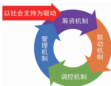
图3 U-G-N-S-S 教师教育公益模式的运行机制