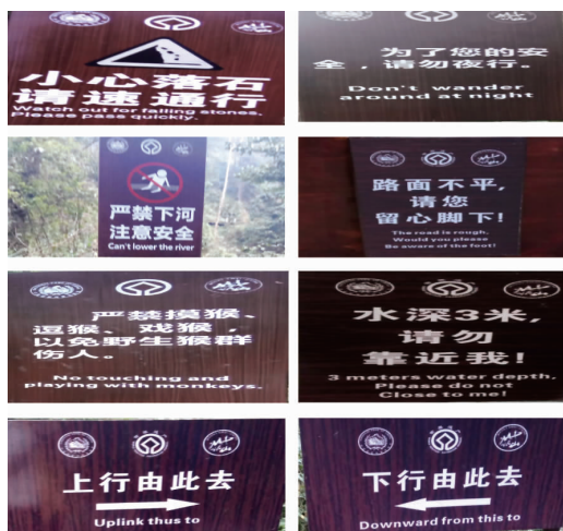
图1 翻译教学中使用的语言景观素材

通过课堂观察,笔者发现语言景观翻译素材具有较强的课堂吸引力。教师在课堂上呈现这些语言景观时,全体学生都表现出浓厚的兴趣,开始与周围同学就语言景观中发现的问题进行交流,并尝试为这些语言景观想出相对合理的译文。笔者在教学中适时引出“Caution: Wet Floor(小心地滑)”“No Smoking(严禁吸烟)”等语言景观,并以此引导学生思考如何运用翻译策略和翻译方法翻译此类提示语。在教师的引导下,学生通过模仿,尝试进行重新翻译(见表1),并推导出“Caution: 具体的提示场景情况”“NO+Ving / Keep away from 短语”“方位副词”等提示语翻译公式。教师通过讲解让学生领会:英文语言景观旨在警醒西方游客,因此要以英语读者为导向进行翻译,采取归化策略与意译译法。