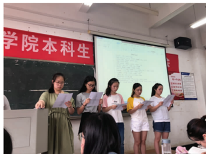
图5 现代诗歌朗诵会图片

教学方法方面的创新主要体现在两个方面:一是以新型教学方法激活课程,提升学生的学习兴趣;二是以研讨型、项目式的方式拓宽课程,聚焦课程的深度与广度。课程主要借助“一课三会”模式开展教学工作。在课堂教学中,以交互式教学取代灌输式教学。通过新媒体交互教学、课堂研讨、话剧表演、诗歌朗诵等多种教学交互形式,丰富师生互动和生生互动(如图5~图6所示);坚持启发式教学,通过对开放性问题的设置构建争论式课堂,培养学生的分析与思考能力,如引导学生讨论“为什么现代文学的开端是个‘狂人’”“如何理解郁达夫的忧郁”等问题;注重理论与实践的结合,在讲授鲁迅、郭沫若、郁达夫、冰心等经典作家的作品时,要求学生撰写读书笔记、文学评论和教学案例,并在读书会、论文研讨会和授课技能交流会中分享、展示,在各教学细节中唤起学生的学习兴趣。