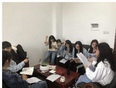
图4 论文研讨会图片

为了实现上述目标,课程改革需要攻克以往重“理论教学”、轻“实践能力培养”的痛点。我校汉语言文学专业为师范类专业,不设方向。专业的师范技能课,如“语文课程与教学论”等课程在第三学期开设,略晚于与中小学语文授课内容交叉的“中国现当代文学”“古代文学”等课程。课程间的时间差不利于学生在巩固专业知识的基础上锻炼教学实践能力。注意到这一问题后,课程建设着重围绕师范人才培养,做好“中国现当代文学(1)”课程与中小学语文教学的衔接,培养和提升学生的授课技能和实践能力。除借助“一课三会”鼓励学生进行授课技能展示外,课程团队还将师范生培养端口前移,选择、打磨、制作了包