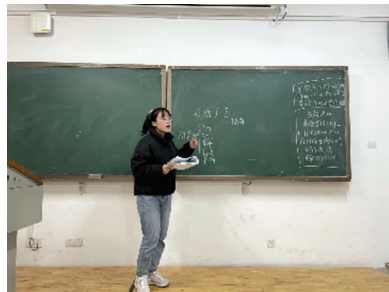
图2 授课技能交流会图片

力。课程教学是知识、能力、素质的结合,既要体现课程的时代性和前沿性,又要在因材施教的基础上培养学生的能力和思维,激发学生的学习兴趣 and 潜能 [1] 。