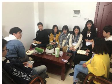
图3 现代文学主题读书会图片