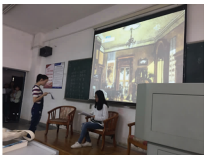
图6 现代话剧《雷雨》表演图片