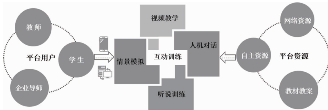
图1 信息化商务英语实践教学平台结构

平台构建目标:打造一个专业知识丰富、互动交流性强、实践运用面广、资源更新及时的实践教学平台。平台结构包括用户、功能、资源三大模块。平台结构如图1所示。