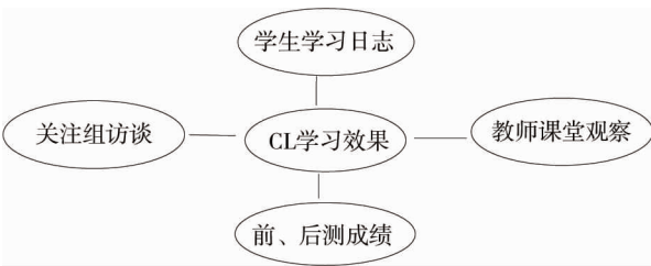
图 2 合作学习效果评价

根据 Cohen, Brody & Sapon - Shevin 对合作学习效果的评价理论(如图 2) [4] , 检定 STAD 学习模式在英语课堂教学中的效果主要来自 4 个方面:学生学习日志、关注组访谈、教师课堂观察以及前、(中)、后测成绩,这也正较好地体现了定性研究与定量研究的有效结合。本研究以杭科院旅游学院酒店管理专业 17 级 1 班 39 名和 17 级 2 班 41 名同学为研究对象,开展了为期 4 个月的基于 STAD 合作学习活动的酒店英语课堂教学,并通过问卷调查和前后测成效对比的定性和定量研究方法评估这一课堂教学的实施效果。