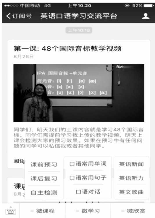
图1 “英语口语交流平台”菜单