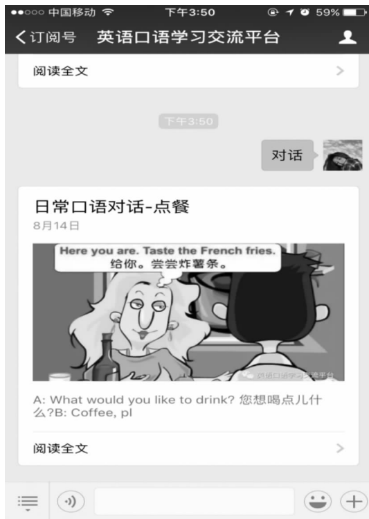
图2 公众号自动回复示例