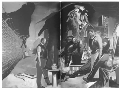
图3 Die Lage, 2006

劳赫精湛的造型技法与娴熟自信的画面控制力,同样为他作品的魅力锦上添花。如图3精彩的人物细节刻画、准确的空间透视关系、丰富的冷暖颜色运用以及强烈的体积处理,这些无疑为劳赫的超现实世界的存在带来更多可信的理由。试想,如果劳赫用一种更为抽象的手法概括画面的人物,或者他技艺有限只能随意的涂抹勾勒,那作品的催眠效果将大打折扣。观者会因为作品技术的不到位,或者画面内容太过于抽象而认为艺术家是在痴人说梦,从而无法从作品中得到共鸣。艺术家就更别指望观者会被作品催眠或是进行深刻的反思了。