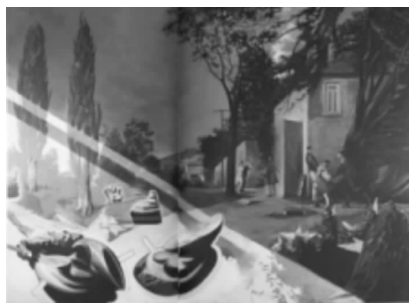
图1 Der Garten des Bildhauers, 2008

尼奥·劳赫的作品内容以具象人物的场景组合为主,同时穿插奇异的生物作为点缀。单看作品中的每一个人物或者场景的局部都显得十分合理正常,符合日常的逻辑。但纵观整个画面,不同人物的组合、错层空间的更叠、奇珍异兽的安排,甚至卡通图案的挪用都会让观者迷失在艺术家无尽的想象中。我们无法第一时间理清头绪,找到作品中所暗藏的含义和主题。也无法确定作品所呈现出的时间线索。黎明还是黄昏,黑夜或者白昼,过去抑或未来,那些漂浮在画面中的不明生物、神秘机械、软体形象、彩色字母或是不知何用的生活用品等,又让观者得以从短暂的迷失中清醒。将注意力重新聚焦到画面的另一层空间,一个完全脱离重力的超现实空间。正如图1所描绘的场景:强烈的人造光源照入昏暗的小镇,几个人物穿梭其中,忙碌的有些不知所措。观众无法确定作者所要表达的具体时间。漂浮在人造光源中的大型软体图像类似于某种生物的内脏器官,强烈吸引着人们的注意力,甚至让人们忘了去猜测画面中的人物关系所暗示的故事情节。我们再看看图1所描绘的内容:身着不同时期服装的人物因为缝制黄色的旗帜而聚集在一间小屋里。一位身着绿色皮夹克帽衫的现代女性成为画面的焦点。她正在为旗帜封边,而在一旁聚精注视的有二战的士兵,