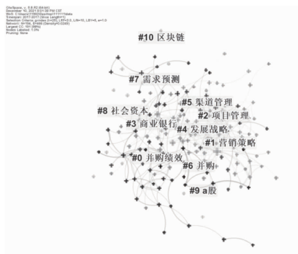
图 3 2017 年 MBA 学位论文关键词聚类图谱

类似地得到图 4 所示的 2018 年 MBA 学位论文关键词聚类图谱。其中,文献知识图谱包含 173 个节点、395 条连线,密度为 0.026 5。论文主题关注度比较高的有:营销策略、发展战略、技术创新、精益生产等。被提及次数最多的还是营销策略和发展战略。营销策略被提及 86 次,发展战