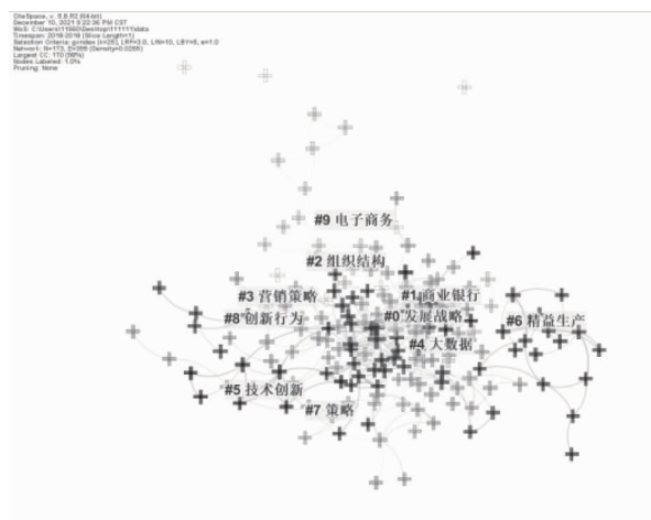
图 4 2018 年 MBA 学位论文关键词聚类图谱

略被提及 82 次。可以看出营销策略和发展战略在 2017—2018 年都是最热门的主题词。商业银行、电子商务以及大数据是 2018 年的研究热点,其中商业银行被提及 28 次;大数据被提及 12 次;电子商务被提及 11 次。