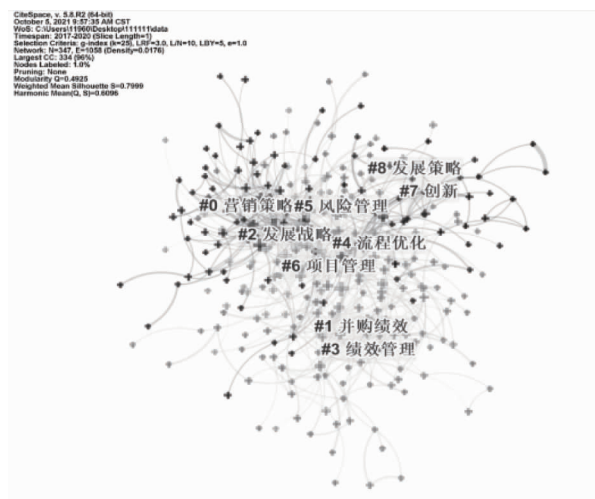
图2 MBA学位论文关键词共现分析

文献列示的关键词代表了该研究的核心议题。本文对CNKI数据库中MBA学位论文研究样本进行分析。以Keyword+term为选择节点,对样本文献进行关键词聚类分析,得到图2所示的MBA学位论文样本文献研究关键词聚类图谱。其中,文献知识图谱包含347个节点、1 058条连线,密度为0.017 6。节点越大意味着关键词的出现频率越高。从图2可以看出,现阶段国内优质MBA学术论文主题关注度比较高的有:营销策略、并购绩效、发展战略、绩效管理、流程优化、风险管理、项目管理等。