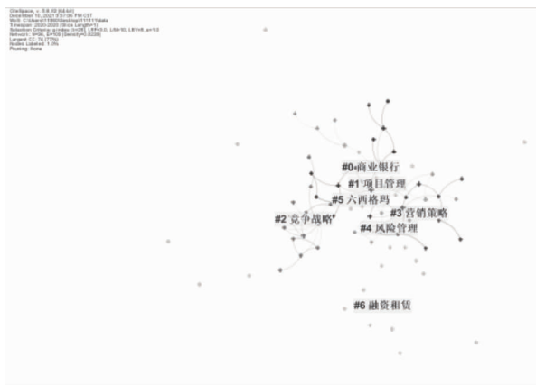
图6 2020年MBA学位论文关键词聚类图谱

2020年主题关注度比较高的有:竞争战略、营销策略、发展战略、风险管理、项目管理等。其中竞争战略被提及26次;营销策略被提及21次;发展战略被提及8次;风险管理被提及17次。研究热点商业银行被提及18次,大数据被提及7次。