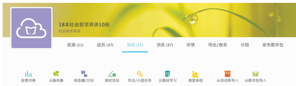
图2 云班课组织课堂活动功能

分成小组,对班课的成员进行管理,方便开展小组讨论活动。在课堂表现方面,教师使用通知、签到、抢答、随机或手动选人功能,实时了解学生的课堂参与情况,督促学生积极参与课堂活动。在讲授完课堂内容后,教师还能够在教学平台上布置和批改作业、发布测试和进行评分,对学生阶段学习的效果进行评估。整个课程结束之后,教师可以很便捷地整理教学包、导出数据,对课程和班级的学习进行总结和管理。云班课组织课堂活动功能如图2所示。